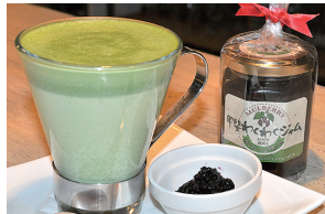
桑カプチャーノ桑の実ジャム添え

を感じるご当地スイーツ」と評判となっています。 大人からお子様までオススメのデザートです。 また新メニューとして、桑の葉カプチャーノも販売を開始。新メニュー開発にも余念がありません。桑の葉の持つ便秘改善やダイエット効果などが口コミによって徐々に広がっていくことを期待しています。 「桑パウダーを使ったメニューを加えたことで、店頭での桑の実ジャムの売れ行きも好調になってきました。今後もパフェやミルクシェイク、スムージーなど、ラインナップを増やしていければと考えています」と保延オーナー。 夏の暑い日差しの中、ひんやりとしたデザートはいかがでしょう？ お近くにお立ち寄りの際には、是非一度こだわりの味をご賞味ください。