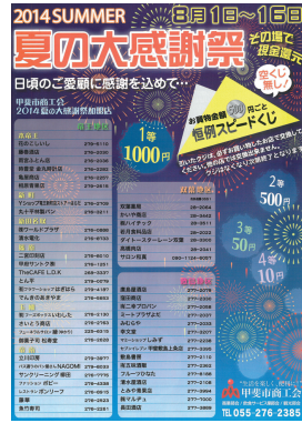
8月1日に新聞折り込みしますのでご覧下さい

お買物500円につきスピードくじを1回引くことができませんので、是非お近くのお店にお出掛け下さい。