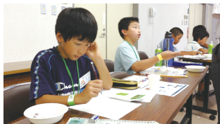
子供たちは少し大人になりました