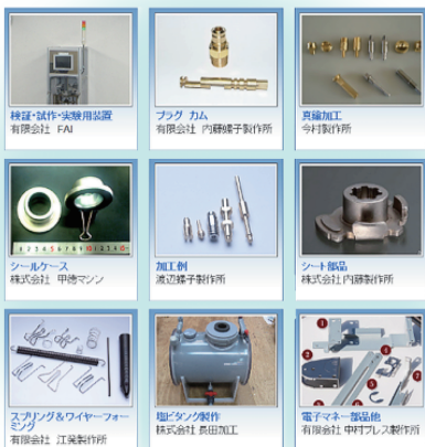
▲ イメージ 「得意技」PR冊子には、各企業の固有の技術を紹介します。

この取り組みは、申し込まいただいた会員企業の「得意技」・「技術分野」等をデータベース化し、自社の受発注取引機会、及び企業間取引に繋がるような基盤づくりを行い、延いては各々参加企業の経営基盤強化を図ることを目的としています。