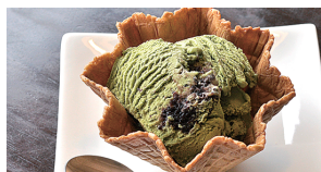
桑パウダーと桑の実を使ったジェラート