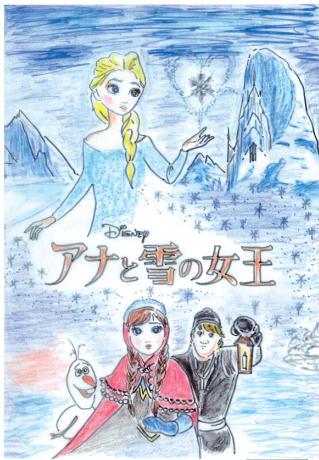
今年はアナと雪の女王を上映します