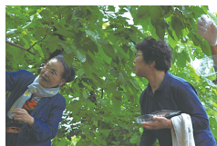
昔がなつかしいね! 桑の実摘み体験

引き続き、県内外の商工会女性部員の参加を促し、本会事業でもある桑関連事業のPRにも協力していきます。