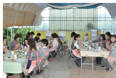
親睦を深めた交流会