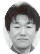
岡山 主 株式会社 ニシノ建設管理