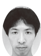
長田 竜太 丸久ホテル 神の湯温泉 株式会社