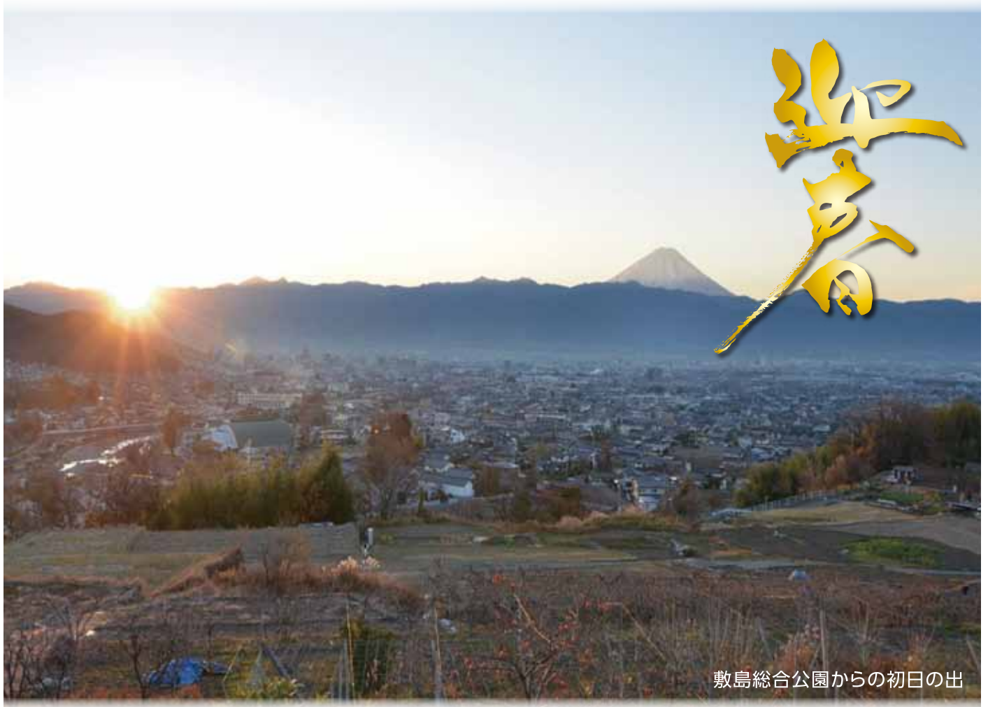
敷島総合公園からの初日の出