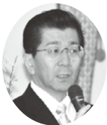
河原政策公庫支店長