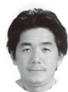
雨宮 光章 株式会社 新光土木