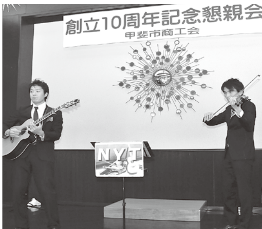
山梨出身「NYT」による演奏