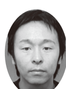
河澄 賢 有限会社 インテリア さいぎ