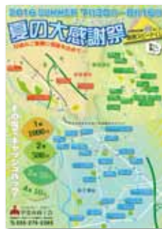
昨年の夏の感謝祭のチラシ

日頃のお客様へご愛顧に感謝して、毎年恒例の「夏の感謝祭」「冬の感謝祭」を実施しています。実施内容は、参加店でお買い物500円毎に1回のスピードくじを引いて、空クジなしで当選金額(最高千円)をその場でキャッシュバックしています。参加加盟店においては、お客様へのサービスの一環として参加してもらい売上増加に繋げて頂いています。なお、今年度夏の感謝祭の実施期間は、7月28日(金)～8月16日(水)の20日間です。