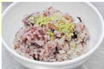
桑の実ジャムごはん