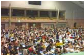
親子ふれあい映画会

昨年度は、持続化補助金の申請にあたり、経営計画書策定研修会を実施して、見事、2企業が採択されました。本年も目標は高く10企業の採択を目指しています。