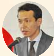
江口日本政策金融公庫 甲府支店長