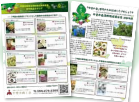
桑試作品&活動PRチラシ

昨年度は、桑の葉を使ったソーセージ・水餃子・食パン、桑の実ごはんやスムージー等の新商品を開発。「わくわくフェスタ」や東京ビッグサイトで開催された「グルメ&ダイニングショー」等の展示会に出展。100件を超える商談が行われ、大手スーパー等と取引が成立するなど大きな成果を挙げた。 今年度も「甲斐の桑」の地域ブランド化を推進するため、既存商品のプ