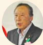
米山市議会副議長