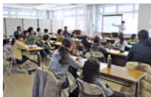
ちびっこ育成セミナー

今年度は、部員の持つスキルを活用して「産業体験ワークショップ」を企画しています。子どもたちに地域の産業に触れてもらうことで、ものづくりの面白さを伝えていければと考えています。