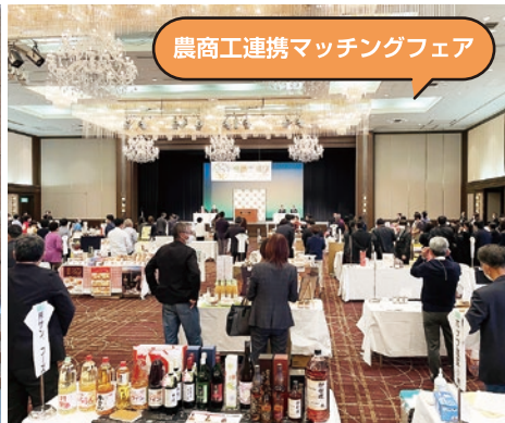
農商工連携マッチングフェア