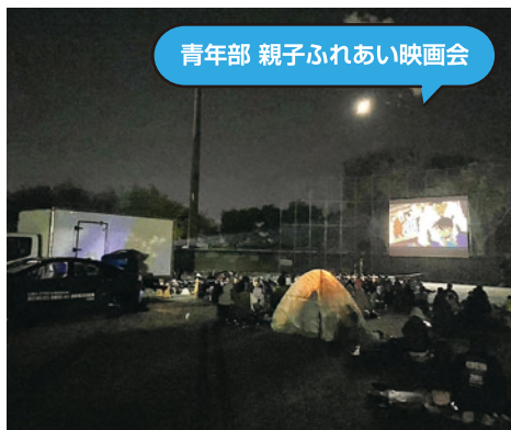
青年部 親子ふれあい映画会

事業活動・決算個別指導会のお知らせ … P1・P2 新NISA・年収の壁 …………… P3 優良従業員表彰・事業所訪問 …………… P3 新会員の紹介・グーペ・社員研修 …………… P4