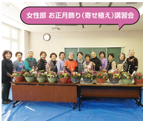
女性部 お正月飾り(寄せ植え)講習会