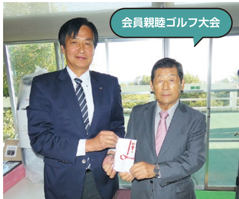
会員親睦ゴルフ大会