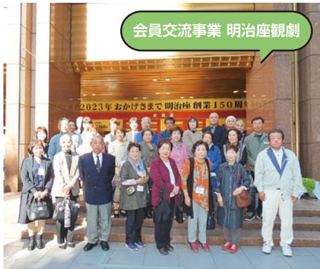
会員交流事業 明治座観劇