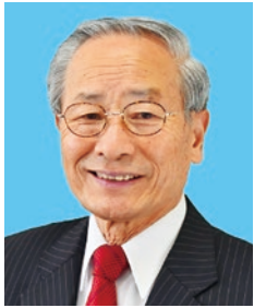
甲斐市長 保坂 武